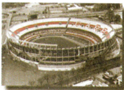
Estadio Monumental "Antonio Vespucio Liberti"

Av. Pte. Figueroa Alcorta 7597 C1428BCL - Buenos Aires República Argentina Tel. (5411) 4788-1200 Fax (5411) 4788-1222 Web Site Oficial http://www.cariverplate.com.ar Correo Electrónico club@cariverplate.com.ar